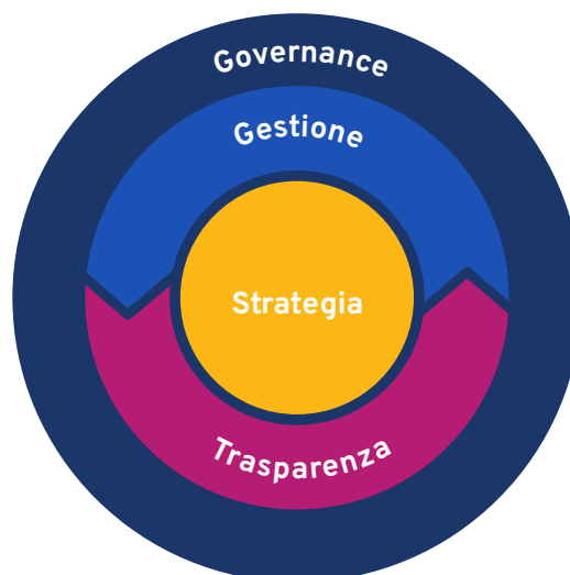
Figura 1: Gli Standard d'impatto sugli SDG

Gli Standard sono organizzati attorno a quattro temi interconnessi – Strategia, Approccio alla gestione, Trasparenza e Governance (vedi Figura 1) – ognuno dei quali svolge un ruolo importante nell'integrare la sostenibilità e il contributo positivo agli SDG nei sistemi organizzativi e nelle decisioni aziendali.